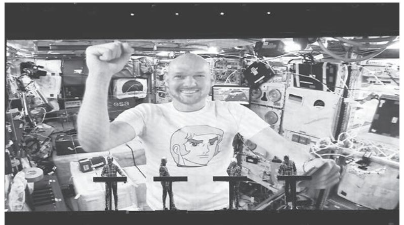
国際宇宙ステーションから共演を果たした宇宙飛行士のアレクサンダー・ゲルストさん

Astronaut 宇宙飛行士。drops in ふらりと立ち寄る。is famous for ～～で知られている。appeared 登場した。synthesizer シンセサイザー。keypad キーボード。stood behind ～～の後ろに立った。notes 音符。Close ... Kind 『未知との遭遇』。aliens 宇宙人。launched into ～～を始めた。